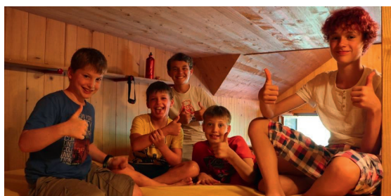
Teenielager Jahrgänge 2012 – 2008 Ort: Schwarzenegg BE Kosten: CHF 250.-