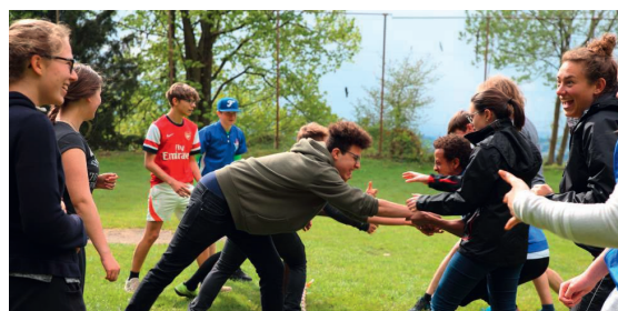
Ausbildungskurs - Modulkurs Leiten 27. – 29. Okt. ab 9. Schuljahr. Kosten CHF 75.-