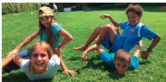
Kinderlager Jahrgänge 2015 – 2011 Ort: Lungern OW. Kosten: CHF 250.-