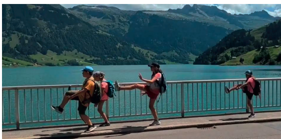
Kinderlager Jahrgänge 2015 – 2011 Ort: Niederuzwil SG Kosten: CHF 250.-