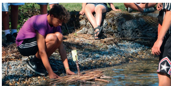
Teenielager Jahrgänge 2012 – 2008 Ort: Schwarzenegg BE Kosten: CHF 250.-