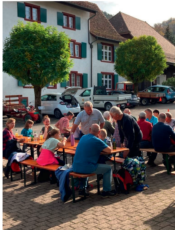
Weitere Bilder unter 'Das Dorf lebt – Tenniken fotografiert'