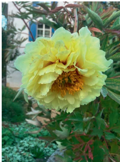
Bildlegende: Diese Strauchpfingstrose blüht momentan auf dem Areal der Gemeindeverwaltung. Aussergewöhnlich, blühen Pfingstrosen doch normalerweise im Mai.